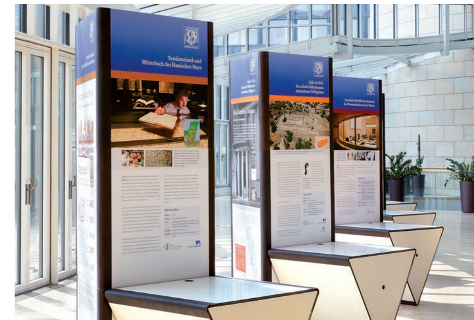
trigo im Foyer des Landtags in Düsseldorf

Atelier für Mediengestaltung hat die Ausstellung konzipiert und gestaltet.